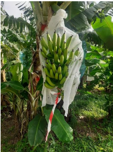
Figure 3 :Etat de certaines gaines (9 semaine après pose) biodégradables opaques ECOVI0 16 micron Déchirure sur soudure lors de la pose