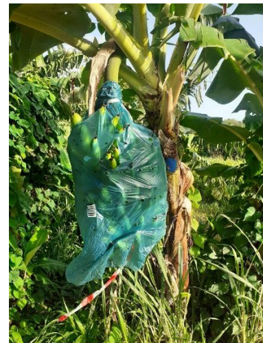
Figure 4 : Exemple de gaine biodégradable Mater-Bi en bordure de parcelle (9 semaines après pose)