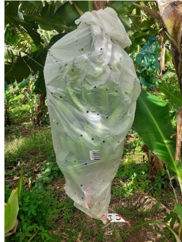
Figure 2 : Etat de gaines biodégradables ECOVI0 & MATER-Bi en Intra-parcelle intacte après 9 semaines